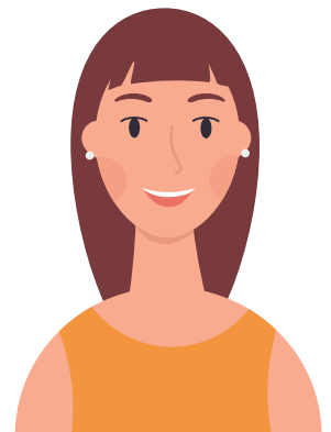
Mensch mit Assistenzbedarf